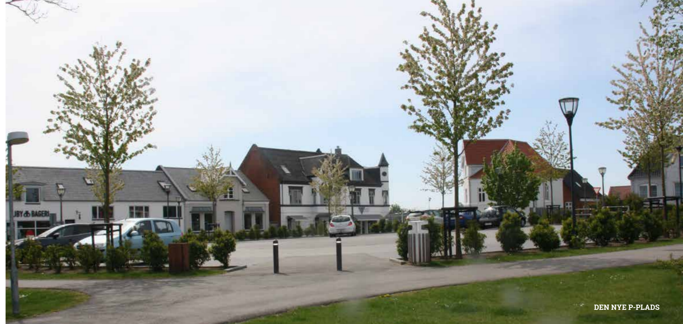
DEN NYE P-PLADS