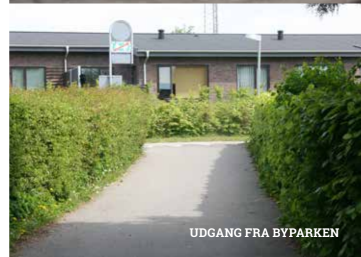
UDGANG FRA BYPARKEN