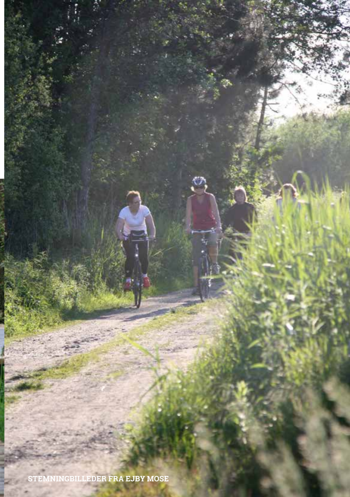
STEMNINGBILLEDER FRA EJBYS MOSE